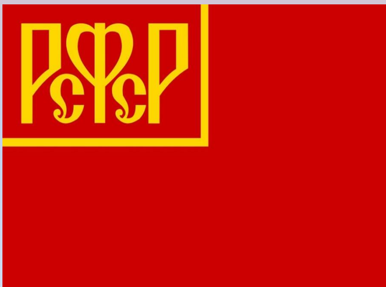
Версия флага РСФСР 1918 года